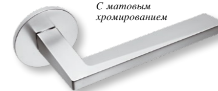
С матовым хромированием