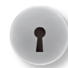
Накладка под ключ 008 А