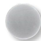
Декоративная накладка 008 Р