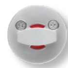
Защелка для туалета 008 WC